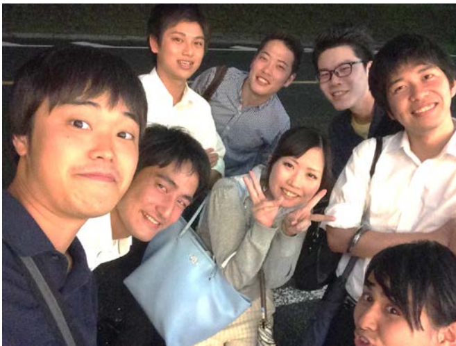
6月に開催された第11期会@二子玉川（著者は中央）

2015年、私の中でいろいろと心境の変化があった。いろいろを書き始めるとあまりにも長くなりそうなのでここでは割愛するが、結論だけを述べると、2015年、私は、大学院への進学を止め2度目の4年生活を