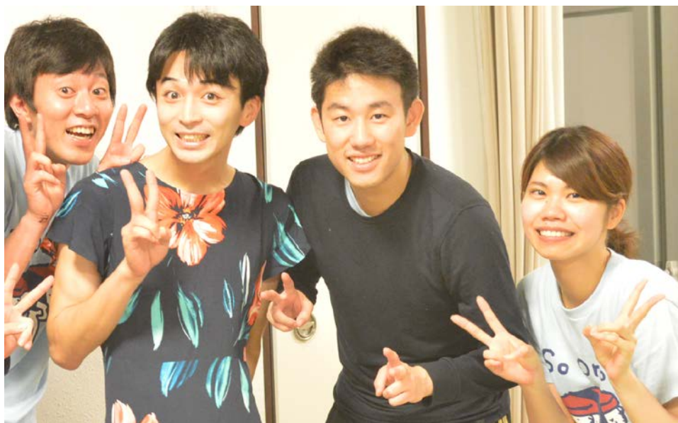
2016年夏合宿の女装コンテストにて（著者は左から2番目）