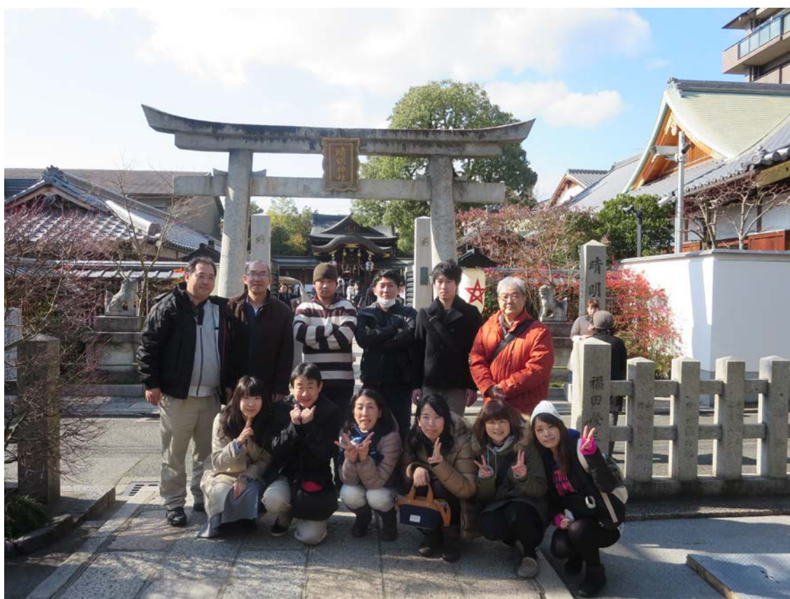
幼児教育課主催の京都旅行にて（著者は前列左端）

役所だし、事務員だからデスクワーク中心なのかなと思っていただけど、仕事の幅広くて驚いています。たまたま、私の異動先が連続してデスクワークじゃないところだった気もしますが、また、役所の異動は異動先によって転職のようだと言われますが、私は2回ともそうで、前課の知識はほぼ役に立ちません。平均3年で異動のところ、私は5年で3課目という短期間の異動で、今まで知らなかった世の中のことを、他の同期より知ることができているのかな〜と思うこの頃でした。