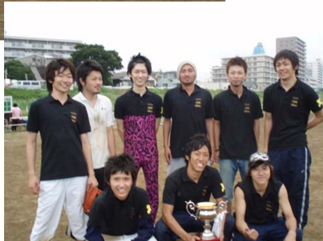
小野ゼミベストナイン